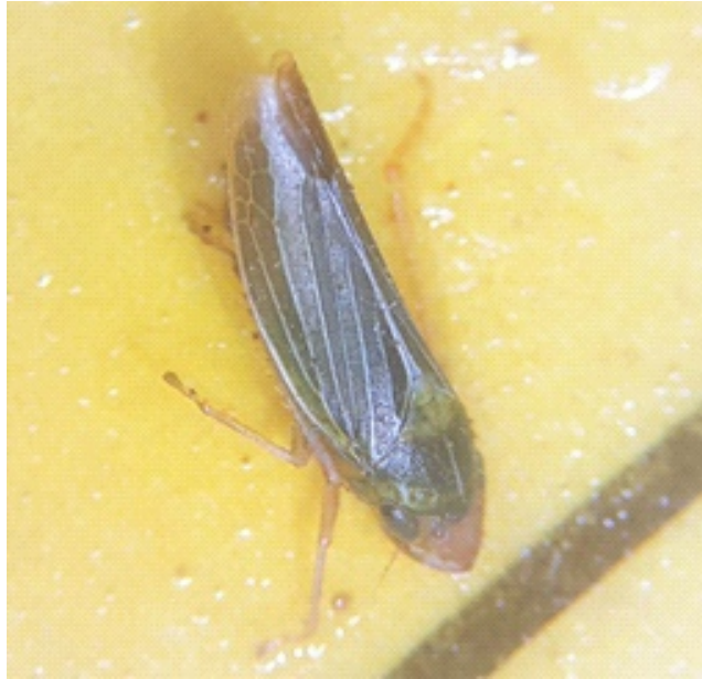
Insecto vector de la bacteria

El proceso de diseminación de la enfermedad inicia cuando las chicharritas (insectos vectores de la familia Cicadellidae), se alimentan de la savia de plantas enfermas y posteriormente transmiten la bacteria a plantas sanas. Estos cicadélidos poseen aparato bucal picador-chupador y al alimentarse de la savia, los adultos y ninfas pueden adquirir la bacteria. La savia con la bacteria es absorbida y retenida en el intestino para finalmente ser transportada al esófago donde se multiplica y forma una cápsula de protección (Gould y Lashomb, 2007).